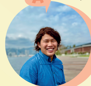
NewGate訪問看護ステーション 看護師